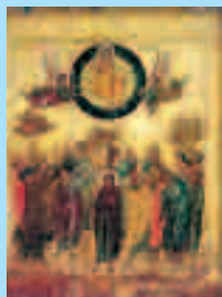
Икона Вознесения Господня

Господа, и наступили трудные времена для христиан. Они подвергались преследованиям и гонениям со стороны язычников и иудеев. К этому времени Златоуст решил двинуться дальше в своем грандиозном путешествии по спасению рода людского. В его планы входили посещения Индии и Китая. На таких огромных расстояниях у него не было никакой возможности совершать визиты в Римскую империю.