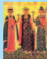
Каган, князь, император Владимир с сыновьями Борисом и Глебом

Владимира относят к ветви русского рода Рюриковичей, он был внуком легендарного основателя династии Рюрика-Лачина [32, 33]. Рюрик-Лачин родился в семье великого кагана Киевской Волжской Болгарии Ру Айдара, он был младшим сыном. Каган Айдар правил империей в 805 – 855 годах. По старшинству следующим каганом стал старший брат Рюрика Джилка, он правил в 855 – 882 годах. Рюрику пришлось сформировать собственное государство, так как у него не было шансов стать великим каганом булгар. При этом все каганы болгар были русскими варягами по происхождению. Отца Рюрика так и звали – Русь Айдар. Каган Джилка управлял огромным государством, расположенным в Поволжье, Средней Азии, Южной России, на Северном Кавказе, в современной Украине и Дунайской Болгарии.