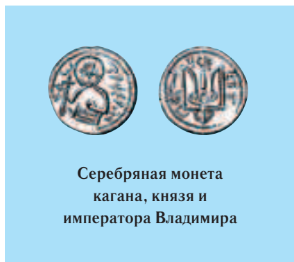
Серебряная монета кагана, князя и императора Владимира

гар Плиске, название которой писалось на старославянском языке как и русского Пскова. То есть брак был династическим и очень важным для рода Дуло, к которому относился и сам Игорь. Но в одной летописи говорится, что в 903 году княжне Ольге, когда она выходила замуж, было только десять лет. Первоначально Игорь правил маленьким Переяславским княжеством, затем Новгородским престолом, а потом и Киевским княжеством.