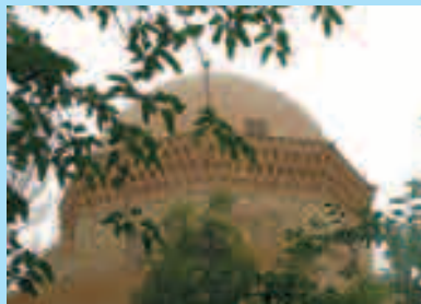
Фото свода тюрьмы Александра Македонского в Иране, город Йезда. Тюрьме якобы 2400 лет, а так хорошо сохранилась

В то же время с детьми младшего брата Александра также ничего не ясно. Полагаю, что Константин Багрянородный, родившийся в 905 году, мог быть сыном как Александра, так и Леона, но вероятнее всего, что он все-таки сын Александра, ведь Константин стал преемником Александра после смерти его в 913 году. Так или иначе, Константин Багрянородный продолжил династию македонских императоров Византии.