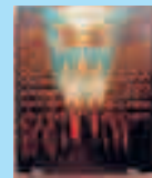
Икона Богородицы и собора Киево- Печерских святых

Рано утром ко всем четверым зодчим пришли благообразные юноши и позвали на встречу: «Зовет вас Царица во Влахерну». Они увидели Царицу и множество воинов вокруг нее. И она сказала им: «Хочу церковь воздвигнуть себе в Руси, в Киеве; повелеваю вам взять с собой золота на три года и идти строить ее». Она послала их к Антонию и Феодосию: «Итак, возьмите золота в избытке и идите. Приду Я и Сама видеть церковь, и хочу в ней жить». Дала она им мощи святых мучеников Артемия, Полиевкта, Леонтия, Акакия, Арефы, Иакова, Федора, говоря: «Положите это в основание церкви». О размерах церкви она сказала: «В меру послала Я пояс Сына Моего, по Его повелению; но выйдите на открытое место, и увидите размеры ее». Зодчие вышли на открытое место и увидели церковь в воздухе. Царица повелела: «Хочу назвать ее в Мое