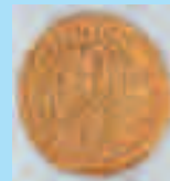
Золотая монета кагана, князя и императора Владимира

Игорь Рюрикович женился в 903 году на Ольге [249 – 252], якобы жительнице Пскова. На самом деле Ольга была представительницей древнейшего рода Кумиров Дуло, она проживала в древней столице дунайских бол-