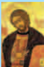
Икона Александра Невского

Юрий Долгорукий был вначале князем Владимирского и Ростовско-Суздальского княжеств, затем Великим князем Киевским – добился он этого, дважды захватив престол вооруженным путем: в 1149-м и 1155 годах. Считается, что он основал города Москву, Дмитров, Переславль-Залесский и Дубну. Юрий Долгорукий был женат на половецкой княжне Аепе, а затем на Ольге, дочери византийского императора. Самые выдающиеся потомки Юрия Долгорукого пошли от сына Всеволода Большое Гнездо (1154 – 1212), Великого князя Владимиро-Суздальской Руси. Всеволоду приходилось скрываться от Андрея Боголюбского, сводного брата, в Византии. Сын Всеволода Ярослав обрел сына, ставшего впоследствии знаменитым князем и полководцем. Это был Святой Александр Ярославович Невский (1220 – 1263) [416 – 427]. Александр родился в небольшой крепости Ям у истоков реки Кубрь и города Переславль-Залесский. Александр Невский разбил шведов на Неве, затем отбросил поход крестоносцев на Русь. В то же время он был в прекрасных отношениях с Золотой Ордой и ее ханами.