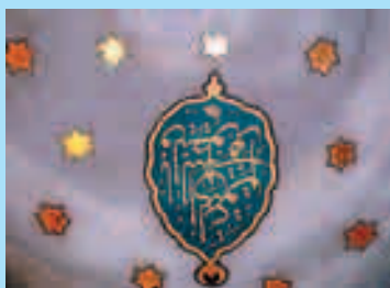
Фото имени пророка Мухаммеда в окружении звезд Давида, храм Святой Софии

Миллиарды людей в мире веками ожидают прихода мессии. Особенно забавно выглядят иудеи, национализировавшие право на рождение пророков и богов для землян. Истина никому не будет по нраву.