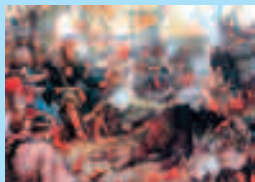
Картина Владимир Мономах после охоты

Результатом русско-византийской войны стала не только женитьба и воцарение на византийском престоле Ярослава Мудрого, но и свадьба его двоюродного внука Всеволода и византийской царевны македонской династии Ирины (Марии, Анны, Анастасии по разным источникам). Личность Ирины точно пока не установлена, вероятно, она была дочерью предыдущего императора македонской династии Константина VIII или IX. Ведь историки