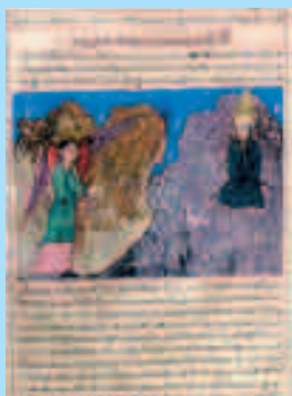
Страница с изображением пророка Мухаммеда и Гавриила

(Шайбу). Сын Хашима или Мутталиба Абдулла обрел от жены Амины сына Мухаммеда, который стал пророком Мухаммедом.