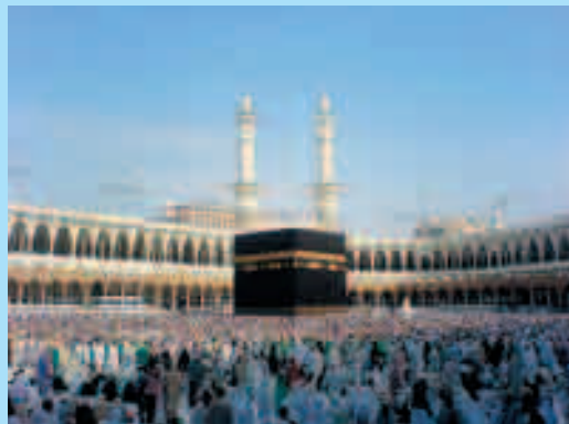
Фото Запретной мечети, Кааба