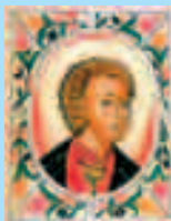
Портрет Юрия Долгорукого из Титулярника

Великого и Юрия Долгорукого [76, 409 – 413]. Мстислав Великий вначале правил Новгородом (1088 – 1117), затем в Переяславле (1117 – 1125), а после смерти Владимира Мономаха в 1125 году перебрался на княжение в Киев, где был Великим Киевским князем (1125 – 1132). Мстислав женился на принцессе Кристине, дочери шведского короля Инге II. Кристина родила много детей. У дочерей Мстислава Великого были браки с королями Дании – Эриком II, Норвегии – Сигурдом I, императором Византийской империи – Алексеем и Венгрии – Гезом II. Прапраправнук Мстислава Великого, Смоленский и Ярославский князь Святой Федор Ростиславович