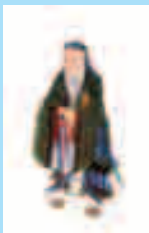
Картина старого Конфуция-Иисуса Христа

За прошедшие тысячелетия несколько человек из рода