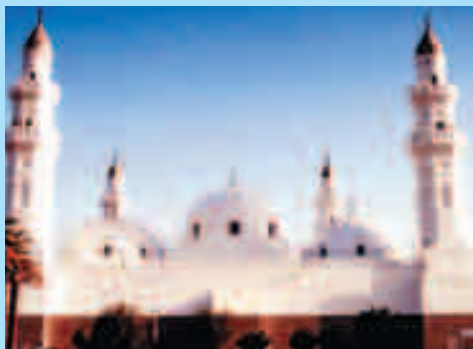
Фото первой мусульманской мечети Куба, Медина

тоже полностью совпадает с древом династии Рюрика и родом каганов русских варягов Дуло [33] : «ибн Ан-Надр ибн Кинан ибн Хузайм ибн Мудрик (имя Мудрик — Амир) ибн Ильяс ибн Мудар».