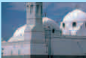
Фото первой мусульманской мечети Куба, Медина

Помимо этого, ибн Набит — современник исхода Моисея из Мица-Рима в 250 — 290 годах. Совместив известные цифровые данные, получим примерное время жизни пророков. Выходит, что Арбат-ибн Иаруб