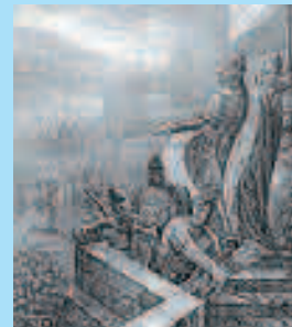
Изображение Мстислава Великого

Знаменитые потомки Владимира Мономаха пошли от двух его детей — Мстислава