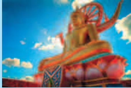
Фото Будды-Иисуса Христа

В Китае Златоуст был уже в зрелом возрасте, попал он туда в 55 – 56 лет. Китайцы запомнили Сына Бога как мудрейшего, седовласого старика, который умел ходить по воде и совершать чудеса. При своем росте «китаец» Конфуций возвышался на пару голов в любой толпе, однако это никого не удивляло. Не заботило китайцев и то, что у него не было родителей и даже могил предков. Конфуция все считали потомком древнего царского рода.