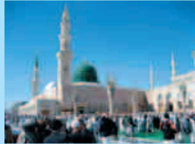
Фото Медины, мечеть пророка Мухаммеда

Для восприятия арабских имен, существенно искаживших оригинальные имена предков Иисуса и Мухаммеда, их следует сравнивать с именами в хрониках болгарских каганов и известной нам по моим работам генеалогии Иисуса Христа из рода Рюриковичей. Сравнительный анализ показывает, что ибн Луаййя — это Владимир, ибн Галиб — это Святослав или его брат Глеб, ибн Фихр — это Игорь, ибн Малик — это легендарный Рюрик. Далее генеалогическое древо Мухаммеда