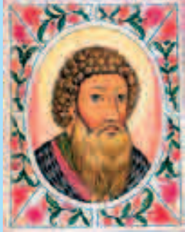
Портрет Ивана Калиты из Титулярника

Невского и Александры, дочери Половецкого князя Брячислава, родилось четверо сыновей. Младший, Святой Даниил Александрович, стал первым Московским князем (1263 — 1303). Он него родился внук Александра Невского по имени Иван, прозванный в народе Калита.